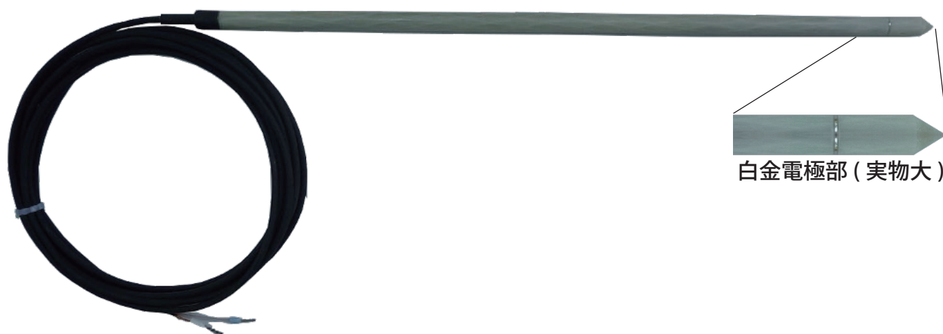
全体図 (全長 30cm)