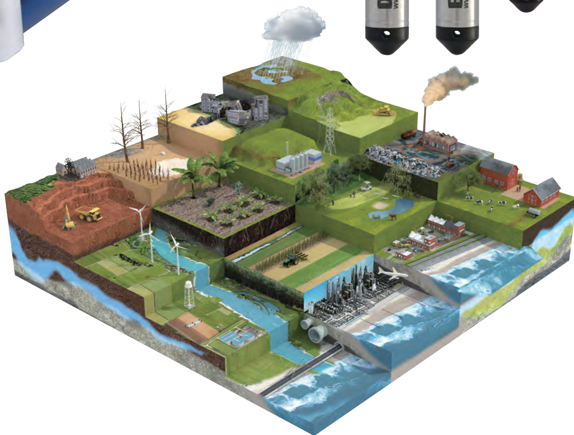
測定サイトイメージ

地下水位の常時モニタリング、河川の水位監視に最適です！ スマートモデム GDT-S は、大気圧測定機能付きです！